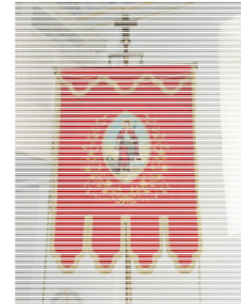
Cafanun da sogn Bistgaun e Nossadunna (Capeder)