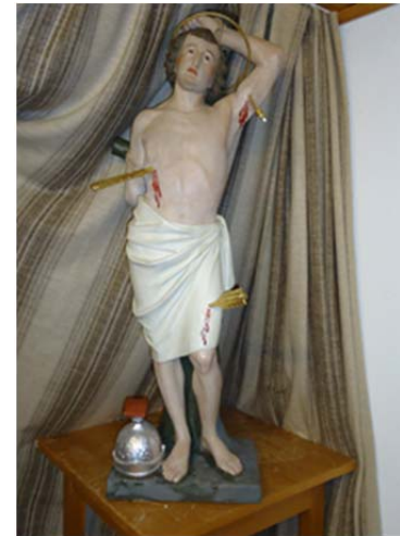
Vut da sogn Bistgaun