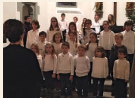
Ils affons da Falera a caschun dil survetsch divin dil plaid 2016

Il survetsch divin vegn embellius cun cant e musica dils affons.