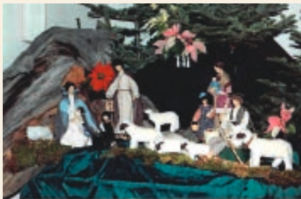
La stalla da Nadal ella baselgia a Falera

In spezial beinvegni fagein nus a nos baptizands e lur famiglias che han festivau il batten el decuors digl onn vargau. A caschun dalla devoziun vegnan las tschittas che pendevan tochen uss en baselgia surdadas allas famiglias.