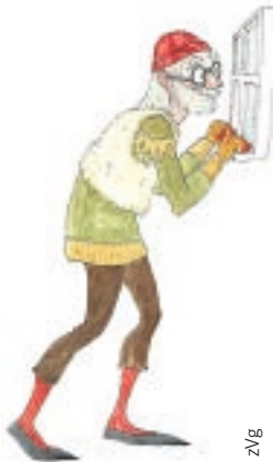
Einer der dreizehn isländischen Weihnachtsmänner, Gluggagægir – «Fensterglotzer», illustriert von Elín Elísabet Einarsdóttir.

Freche Weihnachtsmänner, Kartoffeln in den Schuhen, Elfen und viele Bücher – Gastautorin R. M. Hafstað erzählt von den Weihnachtsbräuchen auf Island.