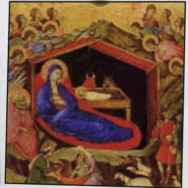
Und das habt zum Zeichen: Ihr werdet finden das Kind in Windeln gewickelt und in einer Krippe liegen. Lk 2,12.

... wir am Samstag, 2. Dezember , das Hochfest des heiligen Luzius , des Patrons unseres Bistums feiern?