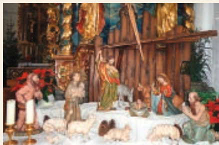
La stalla da Nadal ella baselgia a Laax