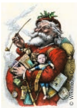
«Merry Old Santa Claus», Thomas Nast, 1863.

Ab 1923 entstand nach Nasts Vorlage eine Werbefigur für das Dry Ginger Ale des New Yorker Getränkeherstellers White Rock Beverages: der Weihnachtsmann. Seinen weltweiten Erfolg trat er jedoch erst ab 1931 an, nachdem Coca-Cola den lachenden Weihnachtsmann für sich als Werbefigur entdeckt hatte. Wer heute bei der Bezeichnung Sankt Nikolaus an einen älteren Herrn mit weissem Bart und lautem Lachen denkt, der in einen roten Mantel mit weissem Pelzbesatz geklei-