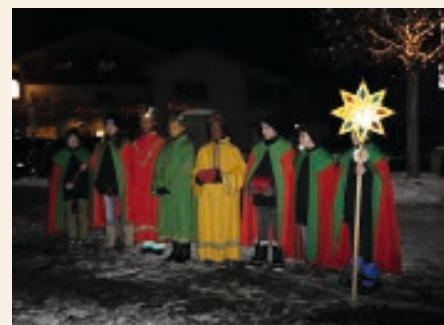
La gruppa dils Retgs da Laax 2017.

Il recav va en favur d'affons en pitgiras. Nus selegrein sin in bien seveser cun Vus.