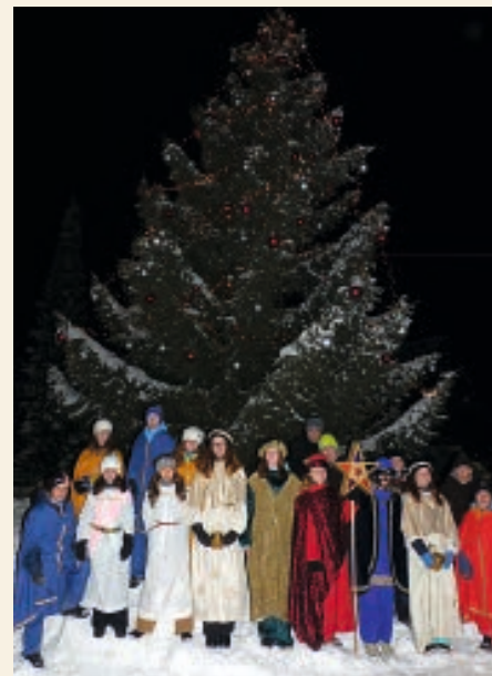
La gruppa dils Retgs da Falera 2017.

Il recav va en favur d'affons en pitgiras. Nus selegrein sin in bien seveser cun Vus.