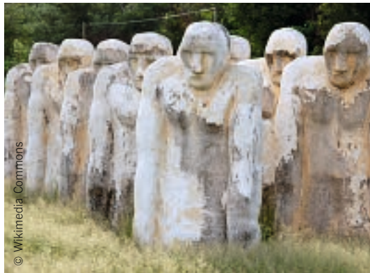
Sklavendenkmal am Strand von Les Mornes, Le Diamant Küste, Martinique, Karibik.

Die Karibik sei noch heute tief von der Praxis kolonialer Ausbeutung geprägt, heisst es im diesjährigen Arbeitsmaterial, das von den Vertretern der Kirchen von Bahamas erarbeitet wurde. Und: