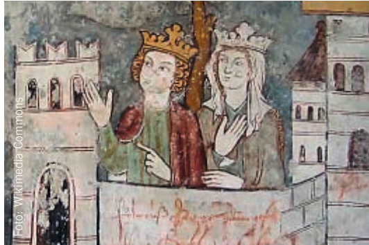
Hände nach Schablonen: Detail aus einem Fresko des Waltensburger Meisters in der Kapelle Maria Magdalena in Dusch ob Paspels.