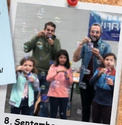
8. September: Jubla-Tag

...der Franziskuskalender 2019 die Buntheit und Vielfalt der Schöpfung zum Thema hat? Mit Fotos und Texten zeigt uns der Kalender auf 132 Seiten die tägliche Vielfalt auf. Zu beziehen ist er für CHF 16.– unter: Franziskuskalenderverlag, Postfach 1017, 4601 Olten, abo@kapuziner.org, Tel. 062 212 77 70. Auszüge unter www.kapuziner.ch/franziskuskalender