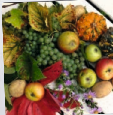
Sonntag, 16. September Eidg. Dank-, Buss- und Betttag!

... wir am 11. September dem heiligen Felix und der heiligen Regula , beide Patrone der Stadt Zürich, gedenken? Bis zur Reformation wurden die beiden Märtyrer in Zürich verehrt. Das Grossmünster , die Wasserkirche und das Fraumünster sind ihnen gewidmet.