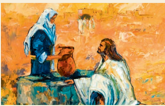
Begegnung zwischen Jesus und der Frau am Jakobsbrunnen aus dem Johannesevangelium.